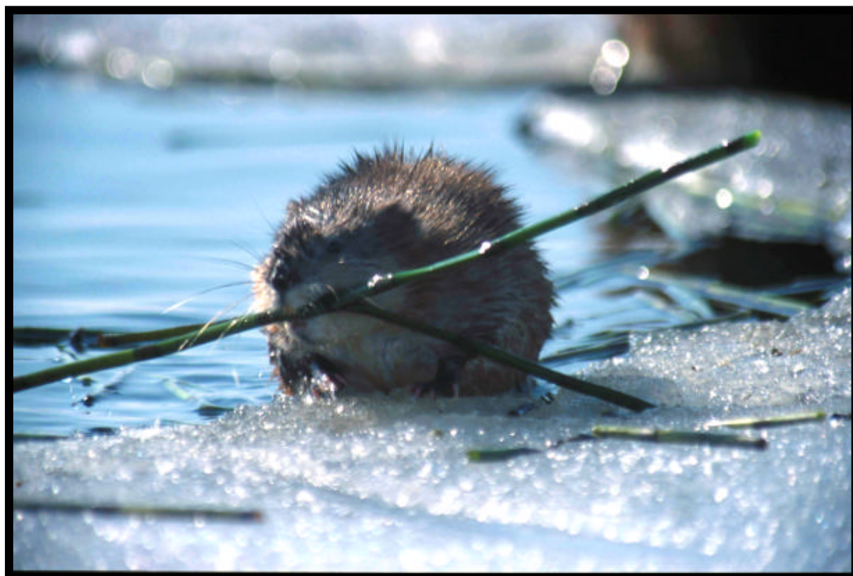
Bisam med mat på iskanten