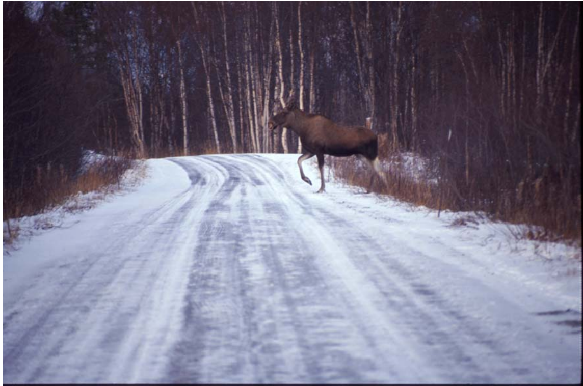
Figur 3. Elg på trekk fra Russland til vinterbeite i Øvre Pasvik må også krysse riksveien.