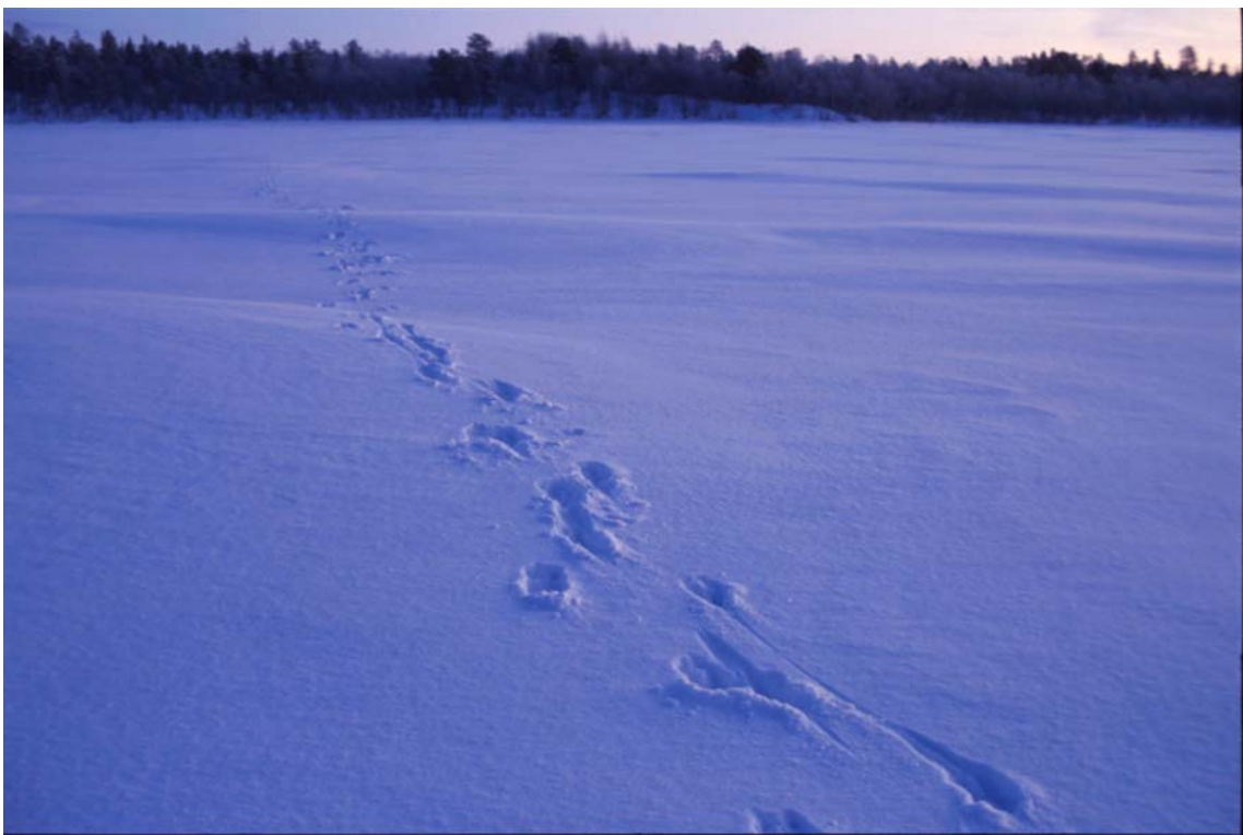
Figur 1. Spor av elg som har krysset Pasvikelva ved Trangsundet i Nedre Pasvik.

Senhøstes og på vinteren begynte trekket tilbake til Øvre Pasvik. Trekketidspunktet varierte fra år til år, og det var tydelig avhengig av vær og klima. Trekket kom tidlig når vinteren kom tidlig. Snømengde, vind og islegging på Pasvikelva var momenter som virket inn. Enkelte ganger varte trekket over lange perioder, og andre ganger kom det meget konsentrert i løpet av noen få dager. I klimatisk dårlige år var det meste av trekket over i løpet av november-desember. Andre ganger gjorde mild høst og lite snø at trekket ikke kom før i januar-februar. I løpet av februar var trekket alltid over, og det var normalt ingen vandring over Pasvikelva senere på vinteren. Registreringene viste at det på de viktigste passeringsplassene i området Trangsundet-Utnes i Nedre Pasvik (sone II) og i området Strykene-Kjerringnes i Øvre Pasvik (sone V) nesten aldri gikk dyr til Russland om høsten og vinteren. Bare i sjeldne tilfeller kunne dyr ble skremt tilbake til Russland eller de valgte å snu. De kom gjerne over til Norge igjen etter en kort tid. Dyrene hadde en målbevisst vandring over Trangsundet og Bjørnsundet i Nedre Pasvik og over Vaggetemvannet i Øvre Pasvik.