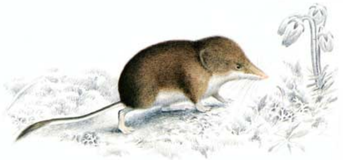
Lappspissmus ( Sorex caecutiens )