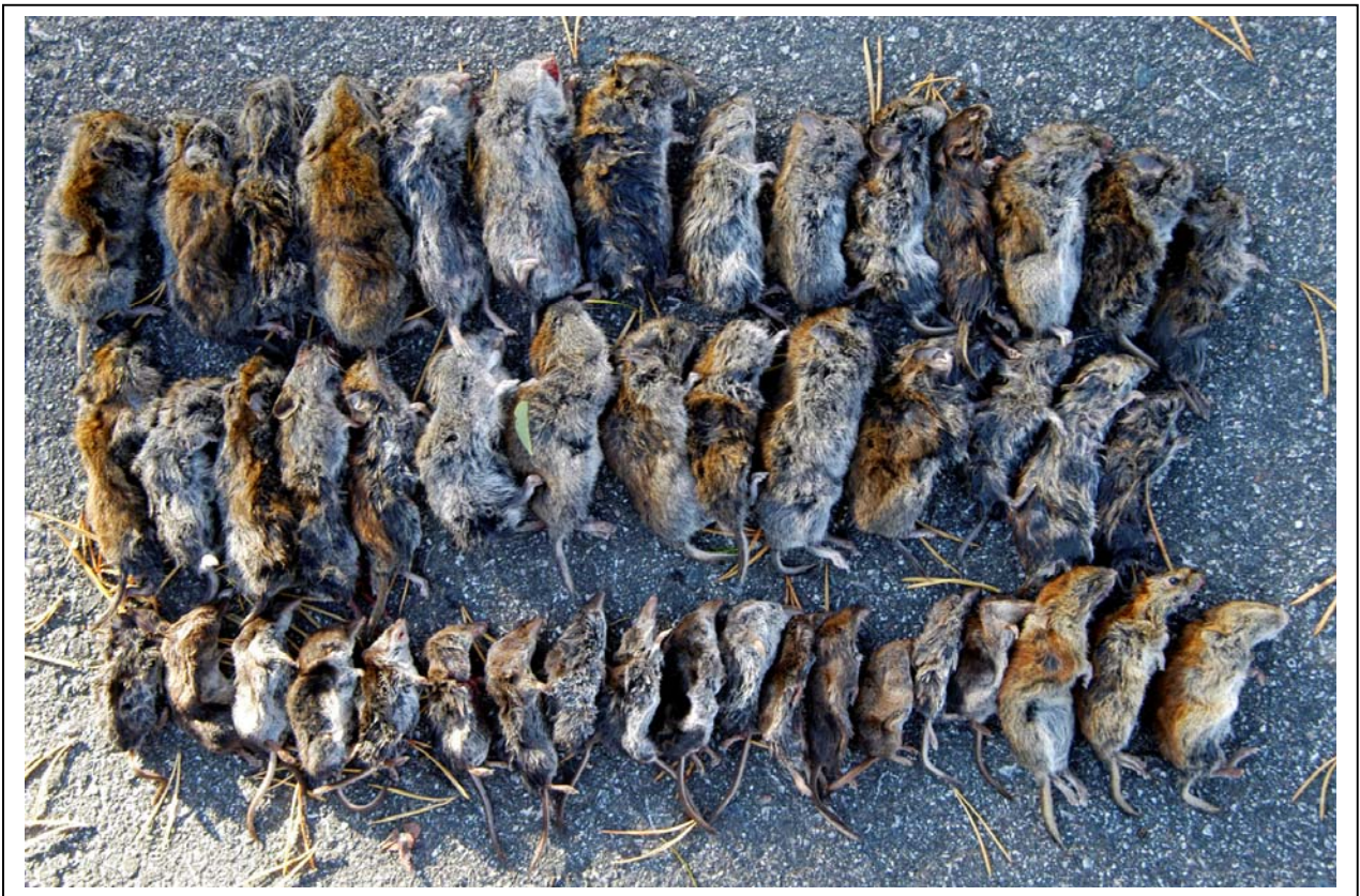
Figur 4. Fangsten av små pattedyr fra felledøgnet 23.-24. september 2006 ved Svanvik. Det var 100 feller ute dette døgnet og det var fangst i nesten halvparten av fellene. På bildet ser vi gråsidemus, rødmus, vanlig spissmus og lappspissmus. Identifikasjon av artene er ikke enkel, spesielt av unge individer. Kontrollidentifisering belager seg blant annet på tannformlene.

Tidligere er det også dvergspissmus ved Svanvik. I nevnte rapport for 2004 er det foretatt en grundig gjennomgang av fordelingen for de ulike artene.